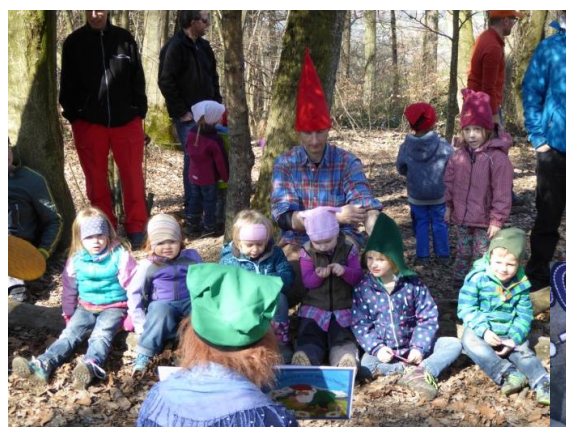
Raurinde und Muggestutz

Allen fleissigen Zwergen ein grosses Dankeschön für den tollen Einsatz beim Reisli und in der Turnhalle.